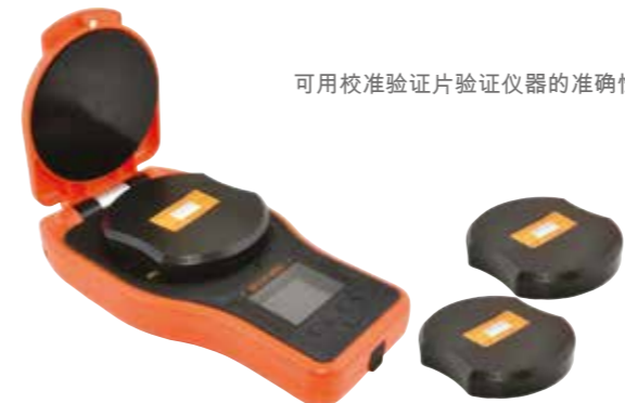
可用校准验证片验证仪器的准确性